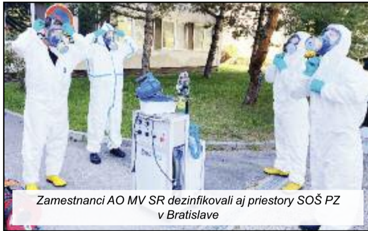
Zamestnanci AO MV SR dezinfikovali aj priestory SOŠ PZ v Bratislave

M. Šula: V bratislavskej prevádzke sme urobili niekoľko personálnych zmien. Na riadiacej funkcii vedúcej servisu máme dokonca prvýkrát ženu, ktorá má všetky predpoklady na špičkovú manažérku. Paradoxne, kríza nám personálne trochu pomohla, ľahšie sa nám získavali kvalitní