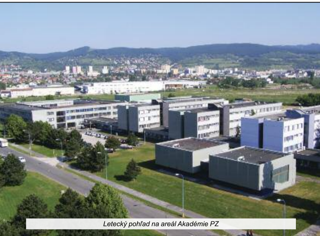
Letecký pohľad na areál Akadémie PZ

Mimoriadne nás prekvapilo uverejnenie článku, dokonca v Právnej rubrike, ktorá by mala pôsobiť smerom k zvýšeniu právneho povedomia, ku ktorému si pán