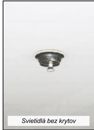
Svietidlá bez krytov