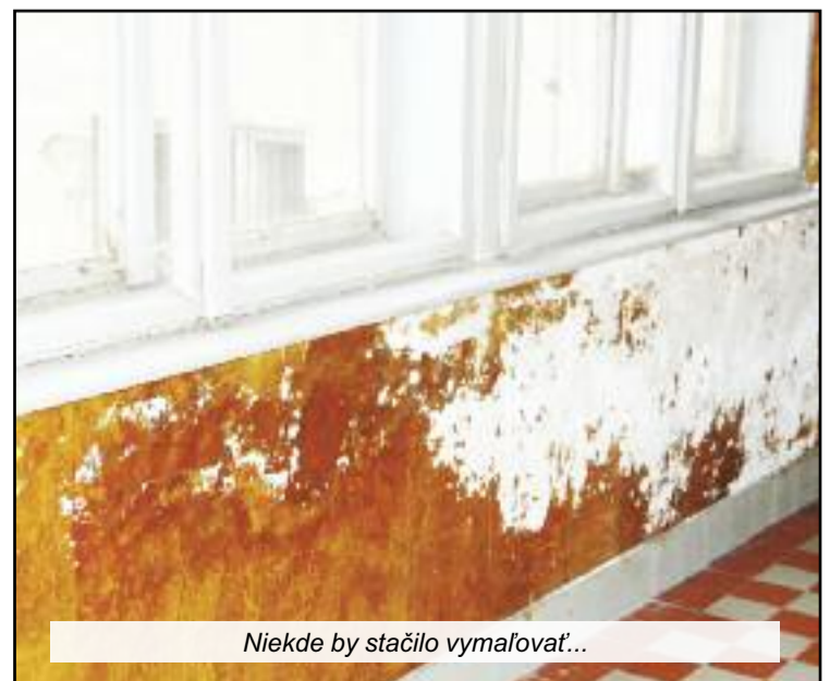
Niekdže by stačilo vymaľovať...