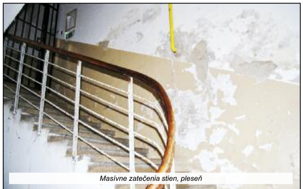
Masívne zatečenia stien, pleseň