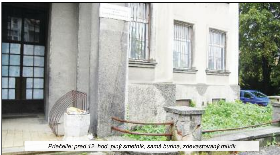
Priečelie: pred 12. hod. plný smetník, samá burina, zdevastovaný múrik