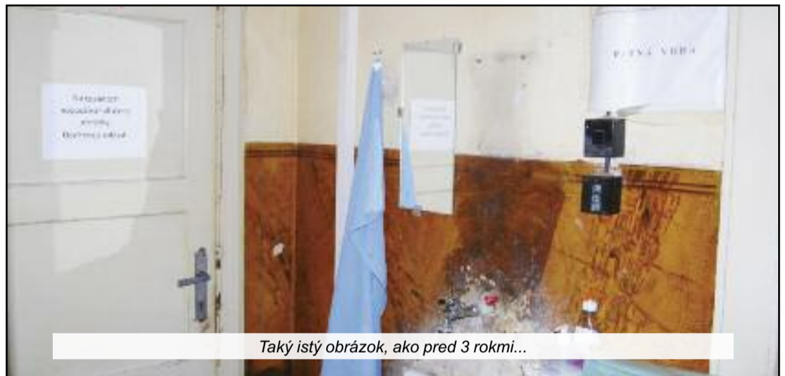
Taký istý obrázok, ako pred 3 rokmi...

V závere roka 2017 boli odboroví inšpektori BOZP na kontrole v objekte Odboru kriminálnej polície OR PZ v Trnave. „Okresný dom“, postavený v roku 1930 podľa projektu architektov F. Florianisa a G. Schreiberera, slúžil ako reprezentatívne sídlo miestnej štátnej správy. Dnes je v hroznom stave - čo v ňom inšpektori videli a zdokumentovali, muselo otriast' každým návštevníkom. Fotoreportáž z tejto vizity /snímky Zuzana Zedková/ sme zverejnili v POLÍCII 1/2018.