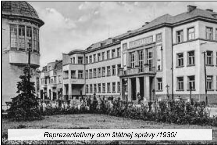
Reprezentatívny dom štátnej správy /1930/