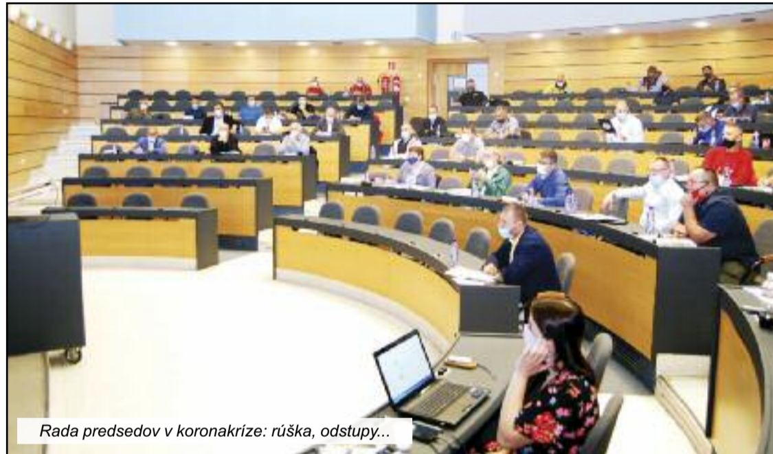
Rada predsedov v koronakríze: rúška, odstup...

Vedenie OZP na základe úlohy zanalyzovalo vývoj podporného fondu tri roky dozadu. Ako uviedol predseda, v priemere sa ročne vyplatí stanovená suma 1000 eur desiatim pozostalým. Predsedníctvo OZP na svojom zasadaní deň pred konaním rady predsedov skonštatovalo, že stav podporného fondu umožňuje zvýšiť vyplácanú čiastku z 1000 na 1 200 eur v prípade úmrtia a zvýšiť sumu z 500 na 600 eur v prípa-