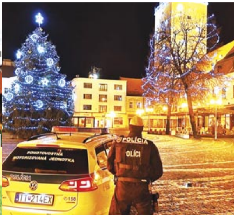
Čarovná atmosféra v Trnave