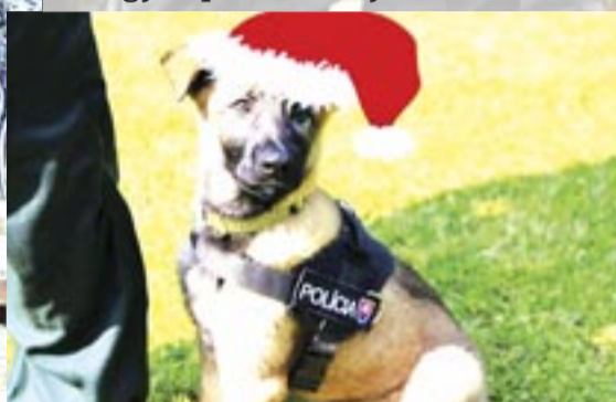
Sviatky si užili aj štvornohí kolegovia