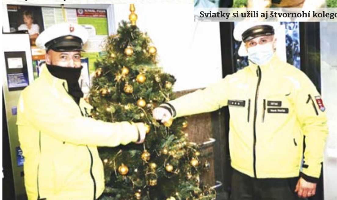
Sviatkovali sme v pohode a bezpečne