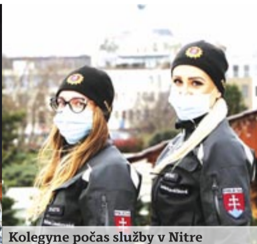
Kolegyne počas služby v Nitre