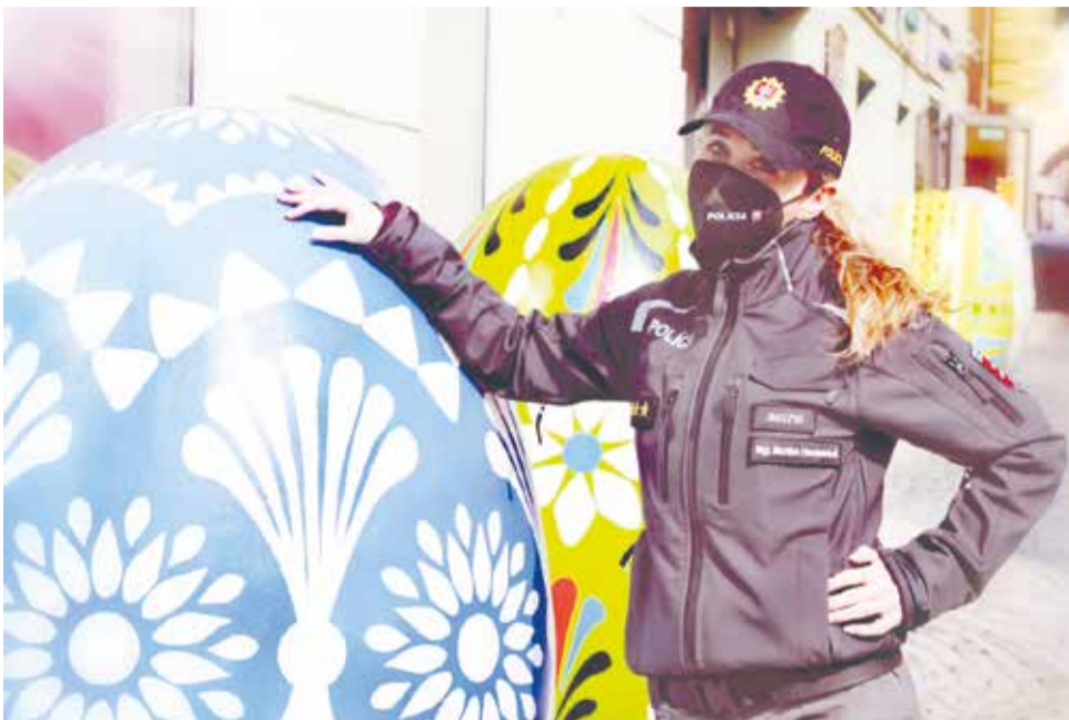
Na východe bolo vždy najlepšie, čo poviete?