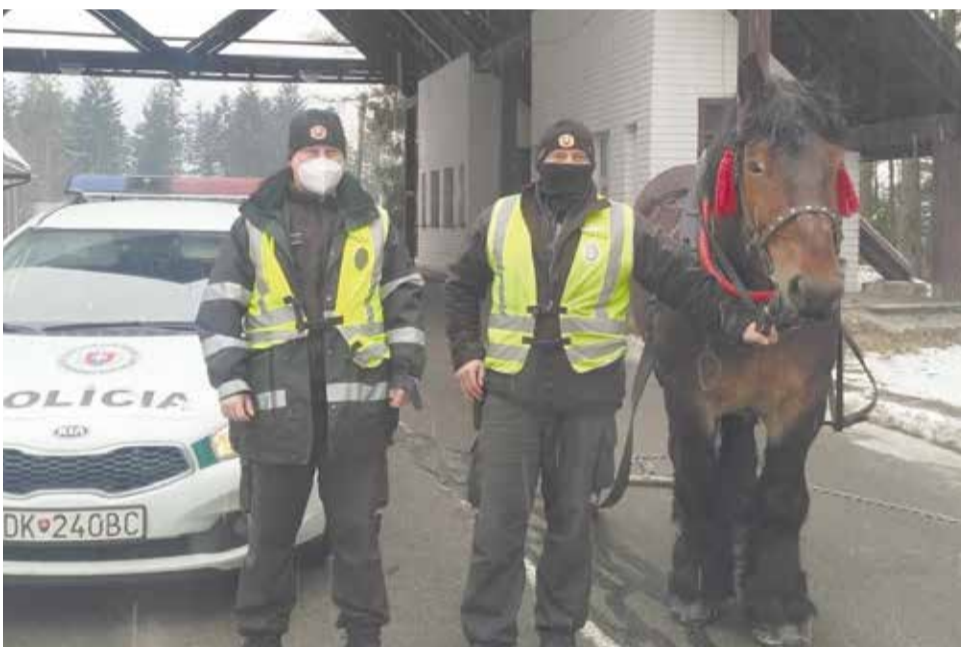
Netradičný veľkonočný pendler na slovensko-poľskej hranici.