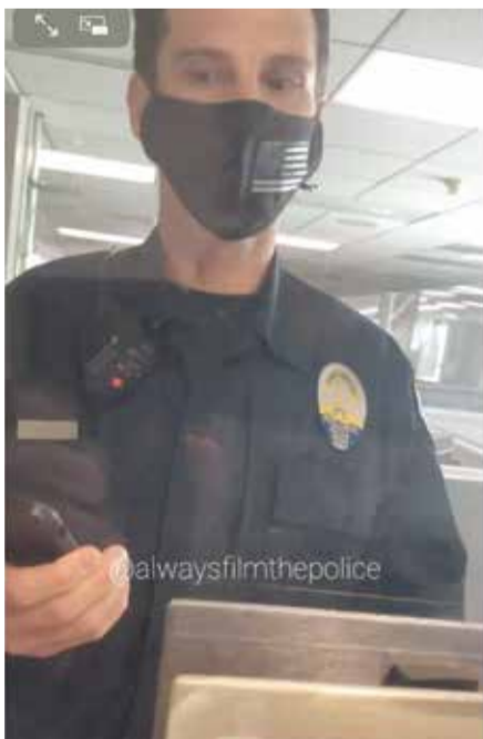
Video s americkým policajtom, ktorý si púšťal hudbu pri nakrúcaní občanom, vyvolalo na internete značný ohlas. Zdroj: internet

Zatiaľ sme nezachytili, že by sa k takémuto kroku odhodlal niekto z príslušníkov Policajného zboru. Ak by aj k tomu došlo, mohlo by dôjsť k podnetu agresívneho občana k vzťahu k naplňovaniu etického kódexu policajta, kde asi púšťanie hlasnej hudby svoje miesto nenájde. V každom prípade, ak by sa aj takáto metóda osvedčila, vymazanie len zvuku ako súčasť videa by nemala žiadny vplyv na prítomnosť menoviek policajtov na zverejnených záberoch. Postup vyskúšaný v USA by naopak mohol istú časť diskutérov ešte viac motivovať v útokoch na konkrétnych policajtov.