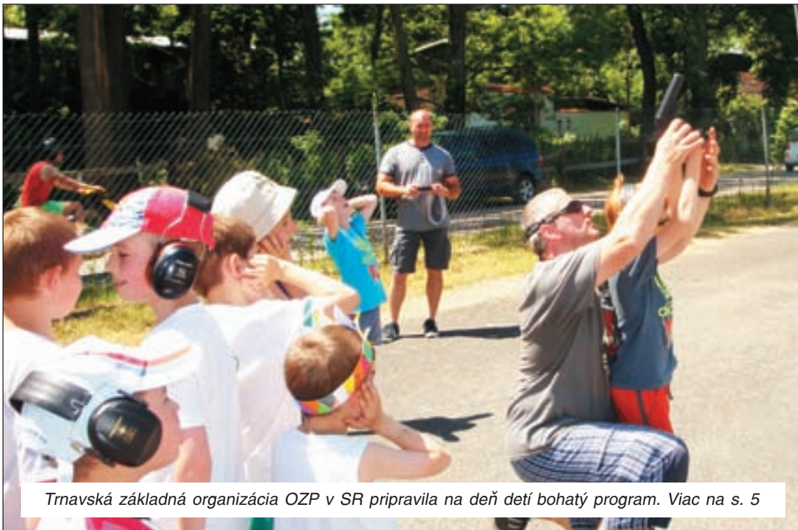
Trnavská základná organizácia OZP v SR pripravila na deň detí bohatý program. Viac na s. 5

Konfederácia odborových zväzov SR (KOZ) žiada zvýšiť minimálnu mzdu od začiatku budúceho roka zo súčasných 352 eur na 399,9 eura. Išlo by o nárast o 13,6 %. Na tlačovej besede to uviedol prezident KOZ Jozef Kollár.