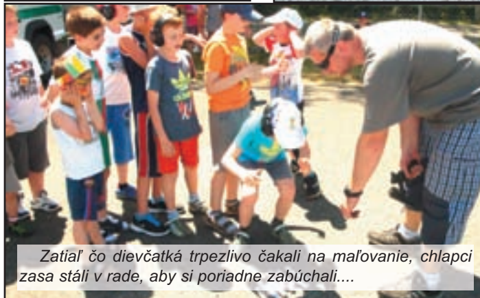
Zatiaľ čo dievčatká trpezlivo čakali na maľovanie, chlapi zasa stáli v rade, aby si poriadne zabúchali...