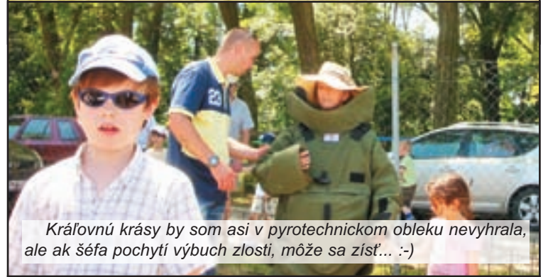
Kráľovnú krásy by som asi v pyrotechnickom obleku nevyhrala, ale ak šéfa pochyty výbuch zlosti, môže sa zísť... :-)