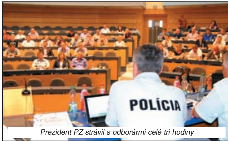
Prezident PZ strávil s odborármi celé tri hodiny