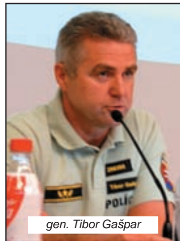
gen. Tibor Gašpar

Prezident vo svojich vystúpeniach na rade predsedov viackrát vyslovil kritiku aj do radov policajtov – najmä pre rozšírené zneužívanie PN a OČR a neschopnosť policajtov vnímať potreby a význam práce príslušníkov iných služieb.