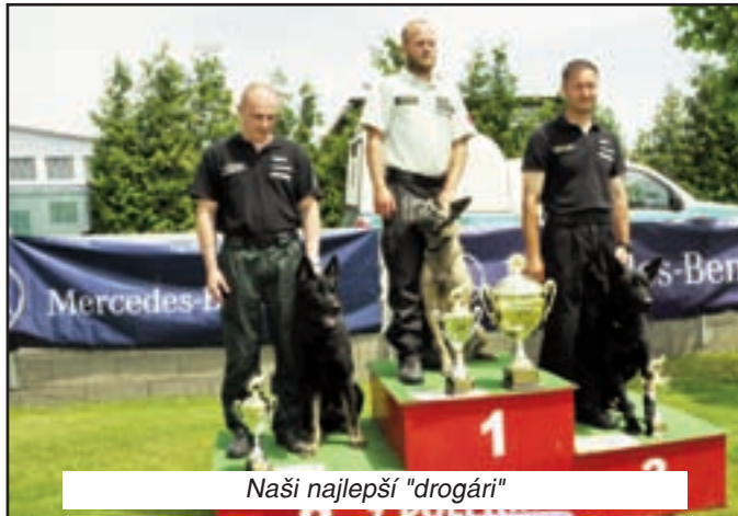
Naši najlepšie "drogári"