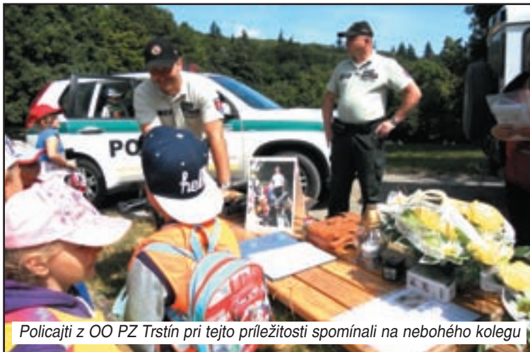
Policajti z OO PZ Trstín pri tejto príležitosti spomínali na nebohého kolegu

vali a vykonávali náročne, so srdcom a rozumom, ale zároveň prístupne verejnosti, hlavne smerom k nášmu drobízgu a dô-