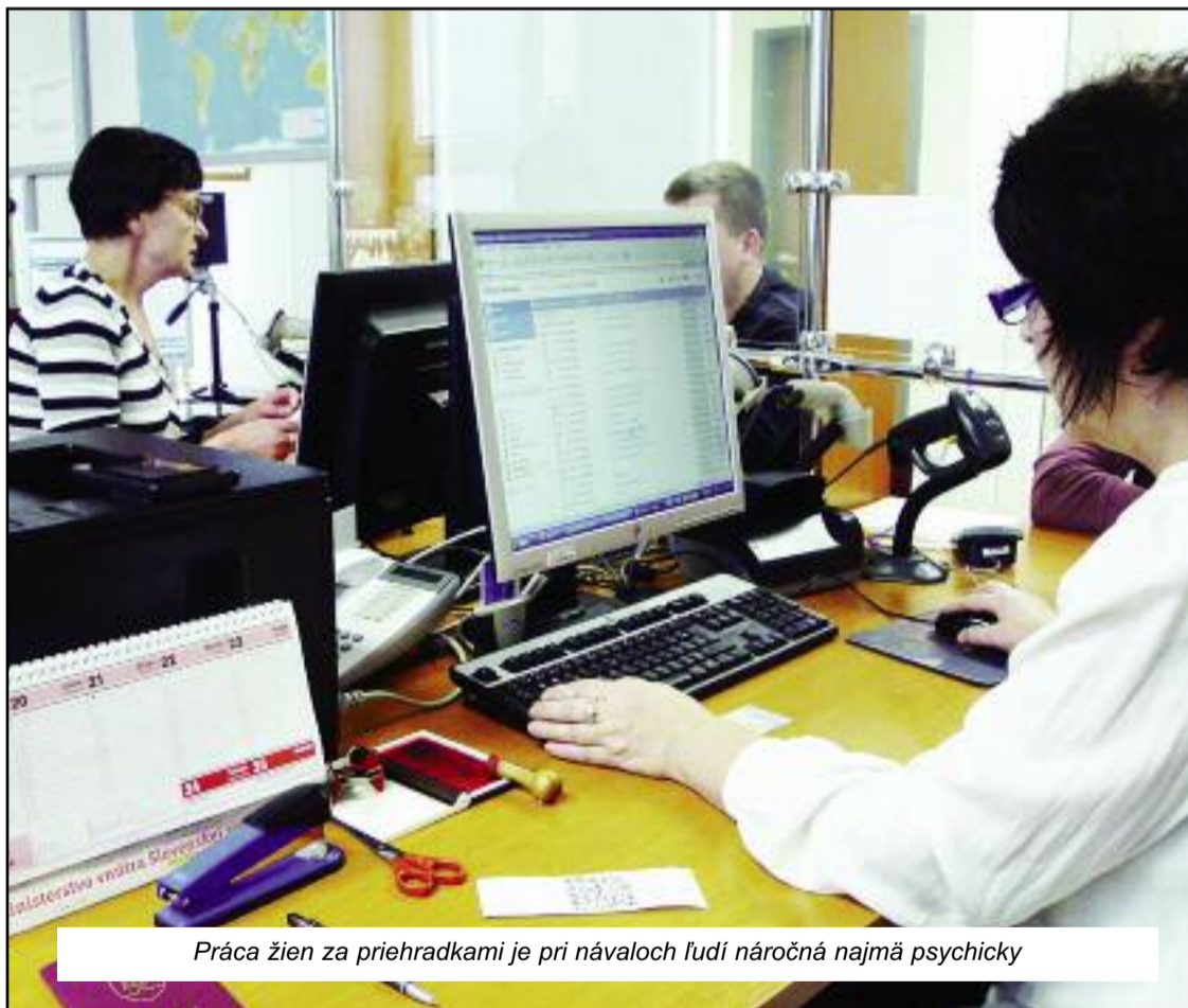
Práca žien za priehradkami je pri návaloch ľudí náročná najmä psychicky

Tak sa téma dostala aj na odborársku pôdu, keď o celoslovensky vážnej situácii diskutovalo aj predsedníctvo OZP v SR. Problém sme v skratke priblížili v decembrovom vydaní POLÍCIA, pričom sme informácie získavali od našich predsedov krajských rád. A tiež sme sľúbili, že sa k téme ešte vrátíme, pretože novembrové prekypanie trpezlivosti žien za prepážkami oddelení dokladov po celom Slovensku ukázalo, že ide o vrchol ľadovca. Problémov, ktoré čakajú na riešenie, sa naozaj nakopilo veľa.