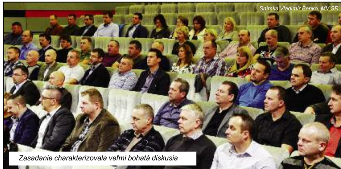
Zasadenie charakterizovala veľmi bohatá diskusia

zlepšiť prácu vyšetrovateľov a „skrátencov“. Problém vidí v ne-skúsenosti mladých poverených policajtov, chyby sa robia v dokumentovaní prípadu i v jeho kvalifikácii. Prezident: „Zaoberám sa myšlienkou zriadiť výjazdové skupiny, ktoré by miesta činu doku-