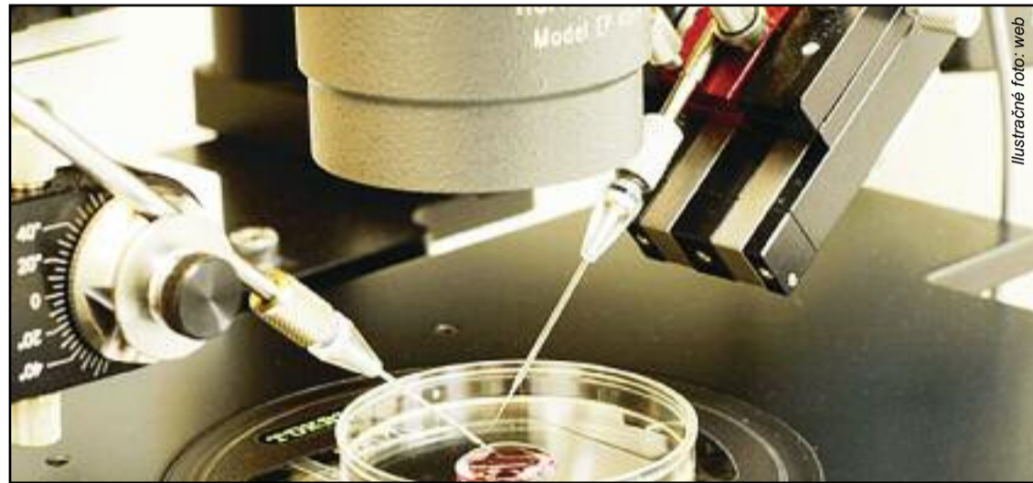
Ilustračné foto: web