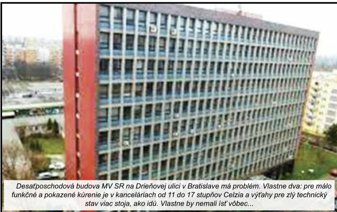
Desaťposchodová budova MV SR na Drieňovej ulici v Bratislave má problém. Vlastne dva: pre málo funkčné a pokazené kúrenie je v kanceláriách od 11 do 17 stupňov Celzia a výťahy pre zlý technický stav viac stoja, ako idú. Vlastne by nemali ísť vôbec...