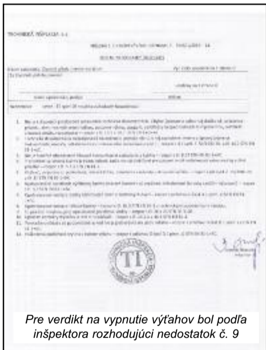
Pre verdikt na vypnutie výťahov bol podľa inšpektora rozhodujúci nedostatok č. 9