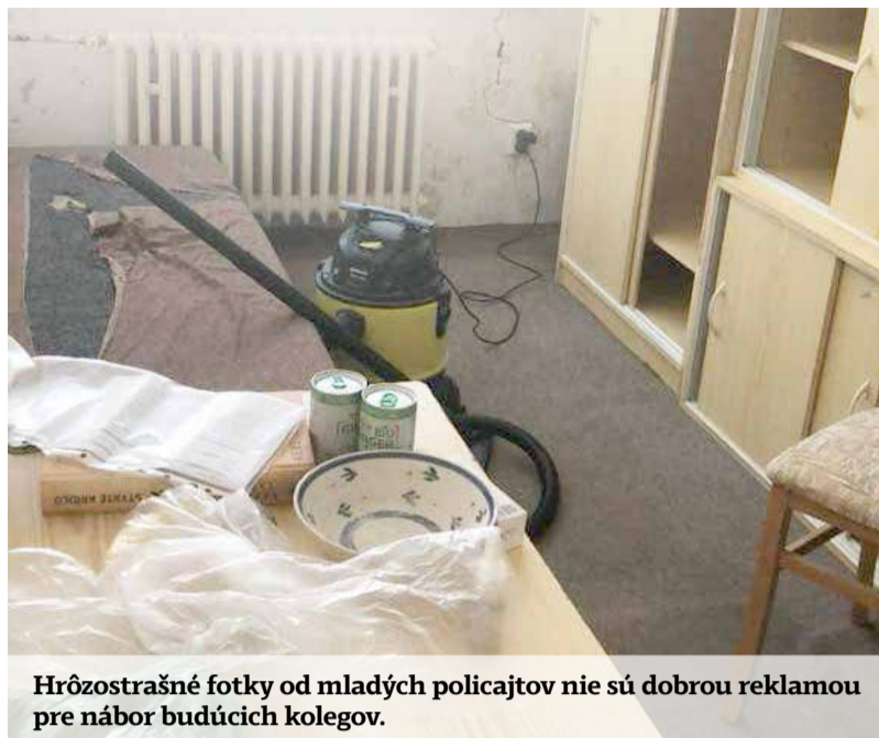
Hrôzostrašné fotky od mladých policajtov nie sú dobrou reklamou pre nábor budúcich kolegov.

demizované, je potrebné nielen technické riešenie, ale aj lepšie plánovanie. Bez tohto komplexného prístupu bude náročné zabezpečiť dôstojné podmienky pre mladých policajtov, ktorých motivácia je už dnes značne oslabená.