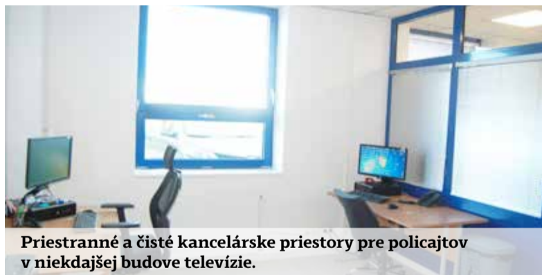
Priestranné a čisté kancelárske priestory pre policajtov v niekdajšej budove televízie.