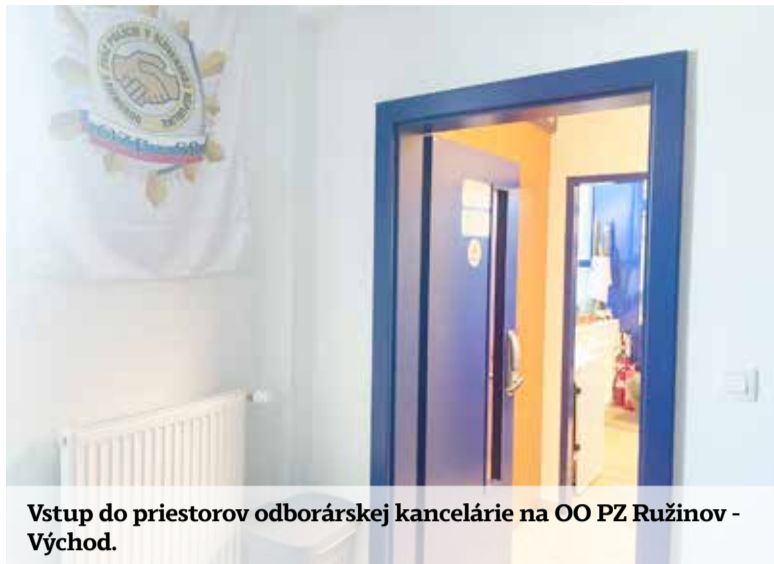
Vstup do priestorov odborárskej kancelárie na OO PZ Ružinov - Východ.

Moderná budova OO PZ Ružinov - Východ je veľkým krokom vpred pre Policajný zbor v Bratislave. Minister vnútra Matúš Štájer Eštok môže po roku vo funkcii vyhlásiť, že niečo po ňom ostalo a že plní sľuby. Ak sa s rovnakou razanciou pustí aj do splnenia ďal-