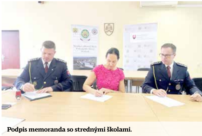
Podpis memoranda so strednými školami.

V médiách v súčasnosti v súvislosti s Policajným zborom najviac rezonuje téma reformy prezidiálnych útvarov. V minulosti boli kritizované postupy, vďaka ktorým sa mohol na pozíciu vyšetrovateľa NAKA dostať aj policajt bez skúseností, len s ukončeným vzdelaním na Akadémii Policajného zboru v Bratislave. Plánujú sa v tomto smere nejaké zmeny, respektíve bude sa policajné školstvo priprávať reorganizácii prezidiálnych útvarov?