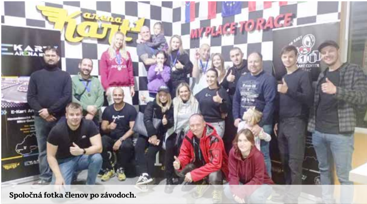
Spoločná fotka členov po závodoch.