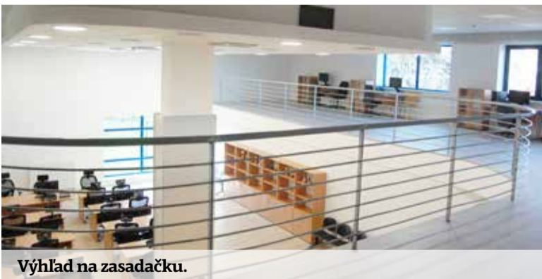
Výhľad na zasadačku.

O riešenie problému sa aktívne zaujímalo aj vedenie Odborového zväzu polície v SR, ktoré