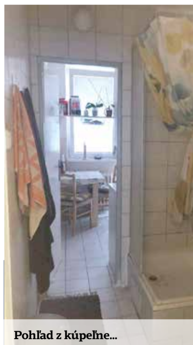
Pohľad z kúpeľne...

Okrem problémov s bývaním čelia mladí policajti aj nečakaným výzvam vo svojej službe. „Práca je oveľa náročnejšia, než