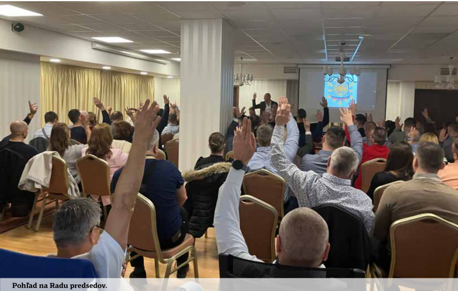
Pohľad na Radu predsedov.

Predstavitelia ministerstva a Policajného zboru zároveň uviedli, že modernizácia materiálneho a technického vyba-