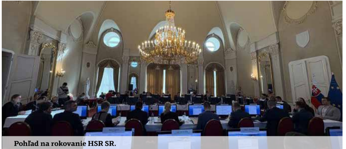
Pohľad na rokovanie HSR SR.

služby v oblasti ochrany verejného poriadku a bezpečnosti.