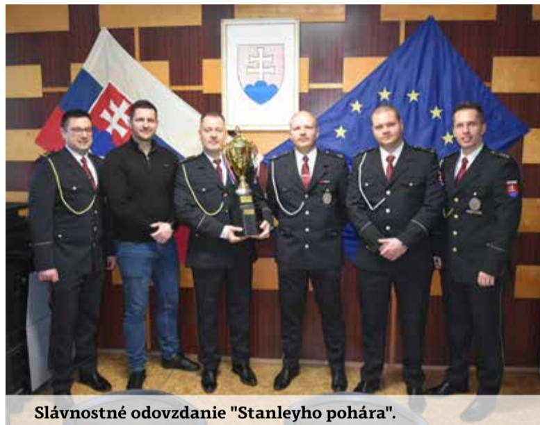
Slávnostné odovzdanie "Stanleyho pohára".