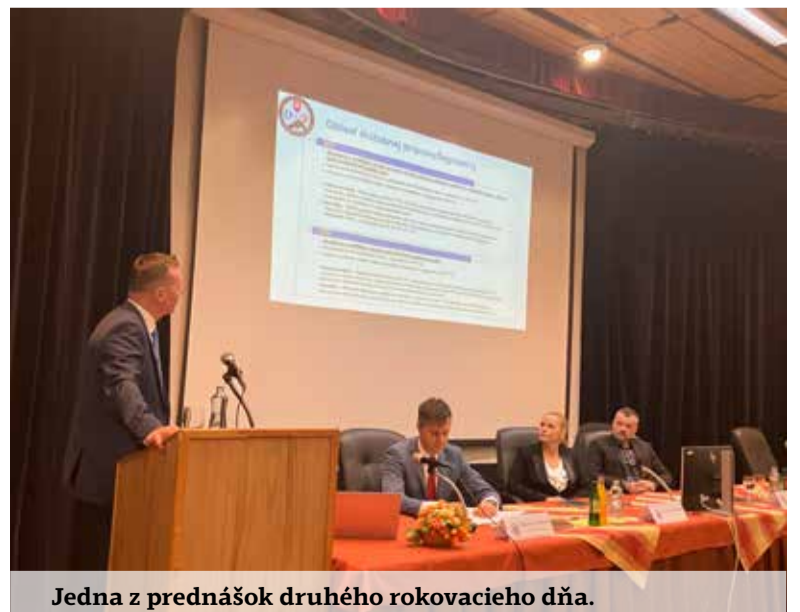
Jedna z prednášok druhého rokovacieho dňa.