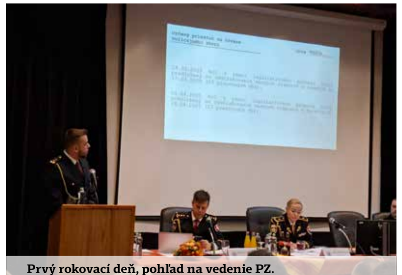
Prvý rokovací deň, pohľad na vedenie PZ.

Podobne ako po minulých rokoch, aj na tomto aktíve dostali priestor zástupcovia jednotlivých prezidiálnych útvarov odprezentovať svoju činnosť ako