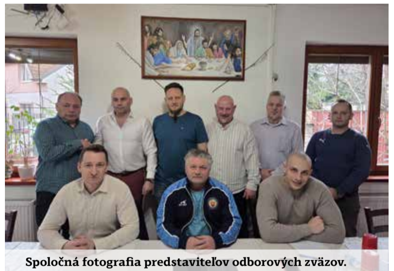
Spoločná fotografia predstaviteľov odborových zväzov.

Problém sa pritom netýka len príslušníkov ozbrojených zložiek, ale aj civilných zamestnancov rezortu vnútra – referentiek, zapisovateľiek, administratívnych pracovníkov okresných riaditeľstiev, pracovníkov klientskych pracovísk, upratovačiek či technického personálu. Viaceré platové triedy a stupne praxe sa nachádzajú hlboko pod úrovňou