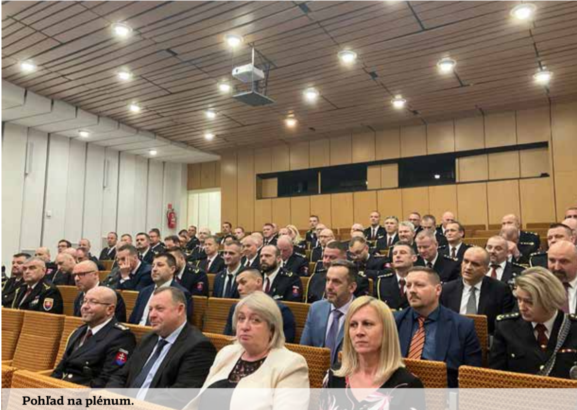
Pohľad na plénum.

aj novinky vo svojej pôsobnosti. Naša redakcia sa zúčastnila na časti diskusie počas aktívu, z ktorej vyberáme.