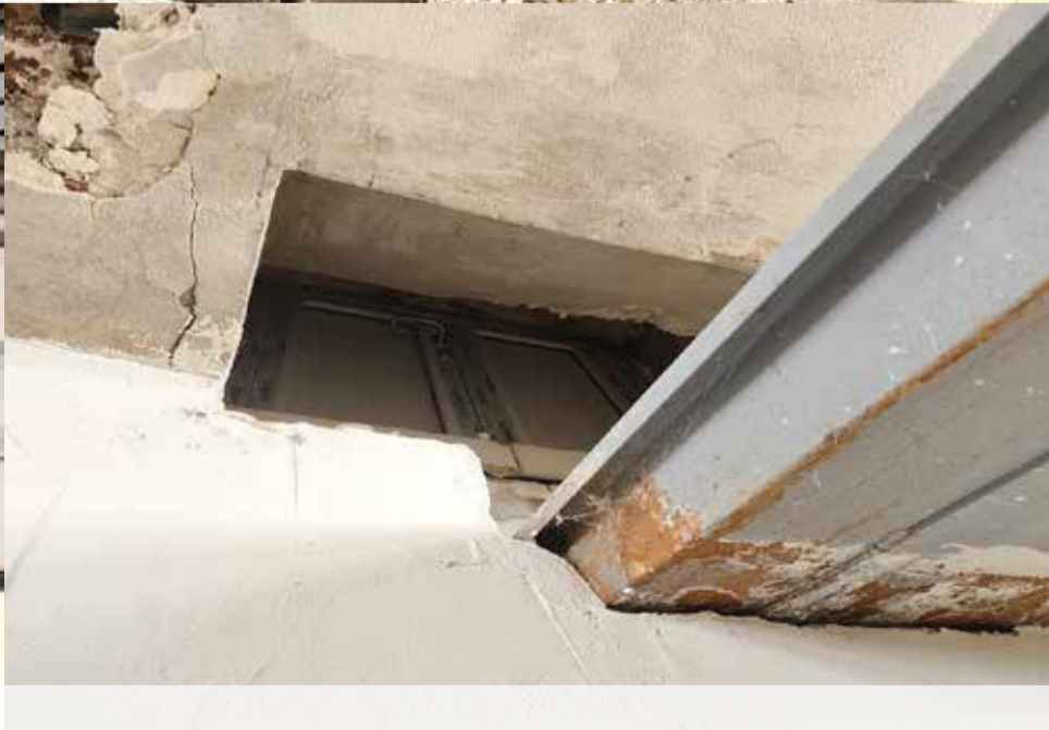
"Zrekonštruovaná" budova OR PZ Bratislava III.