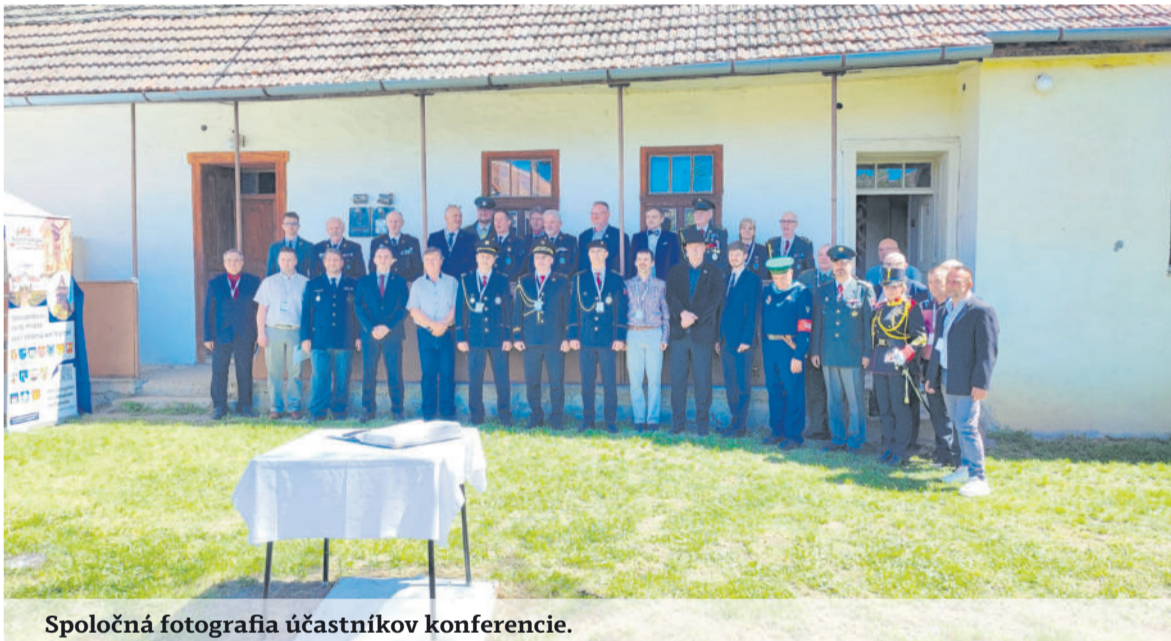
Spoločná fotografia účastníkov konferencie.