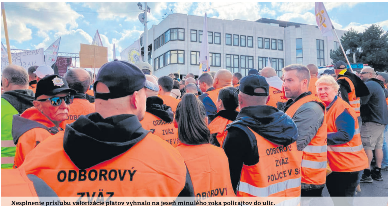
Nesplnenie prísľubu valorizácie plátov vyhnalo na jeseň minulého roka policajtov do ulíc.