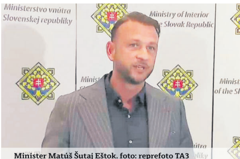
Minister Matúš Štajer Eštok.

Eštok pri rokovaníach o budúročnom rozpočte otvorene hovorí o naplnení záväzku z Programového vyhlásenia vlády a dokonca vyhlásil, že bez zvýšenia plátov policajtov rozpočet podporený nebude.