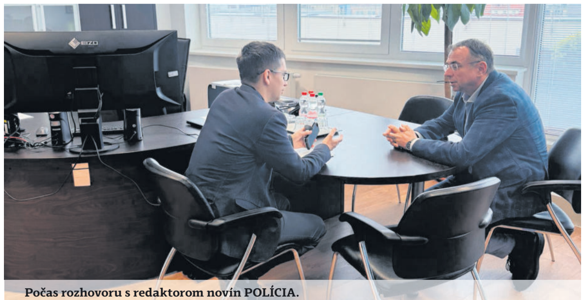
Počas rozhovoru s redaktorom novín POLÍCIA.

Nie je to úplne tak. Je to síce určitá kompenzácia, ale keby tento systém neexistoval, nemocnica by fungovala úplne inak a poskytovala by len základnú zdravotnú starostlivosť. Máme možnosti spolufi-