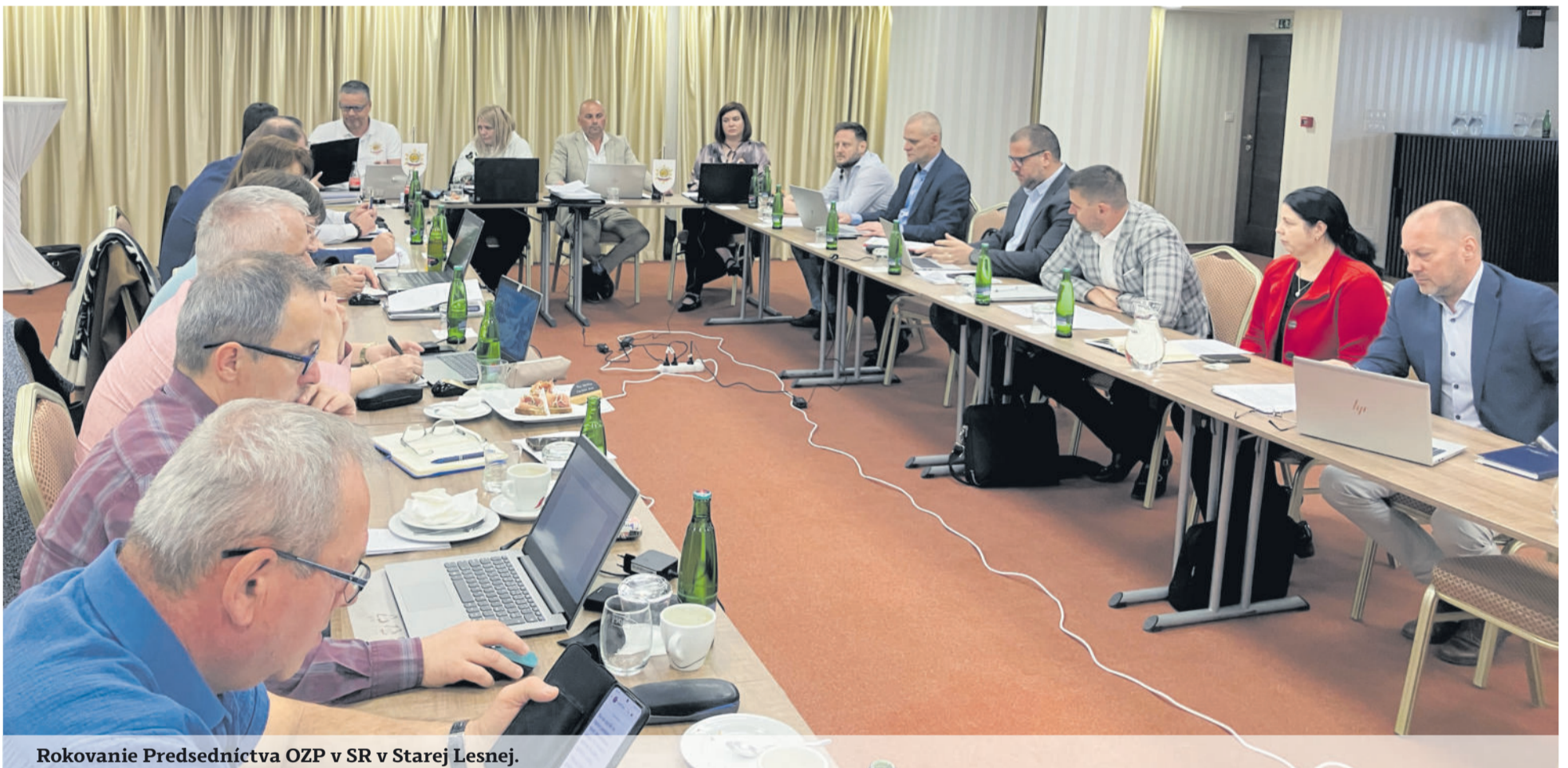
Rokovanie Predsedníctva OZP v SR v Starej Lesnej.