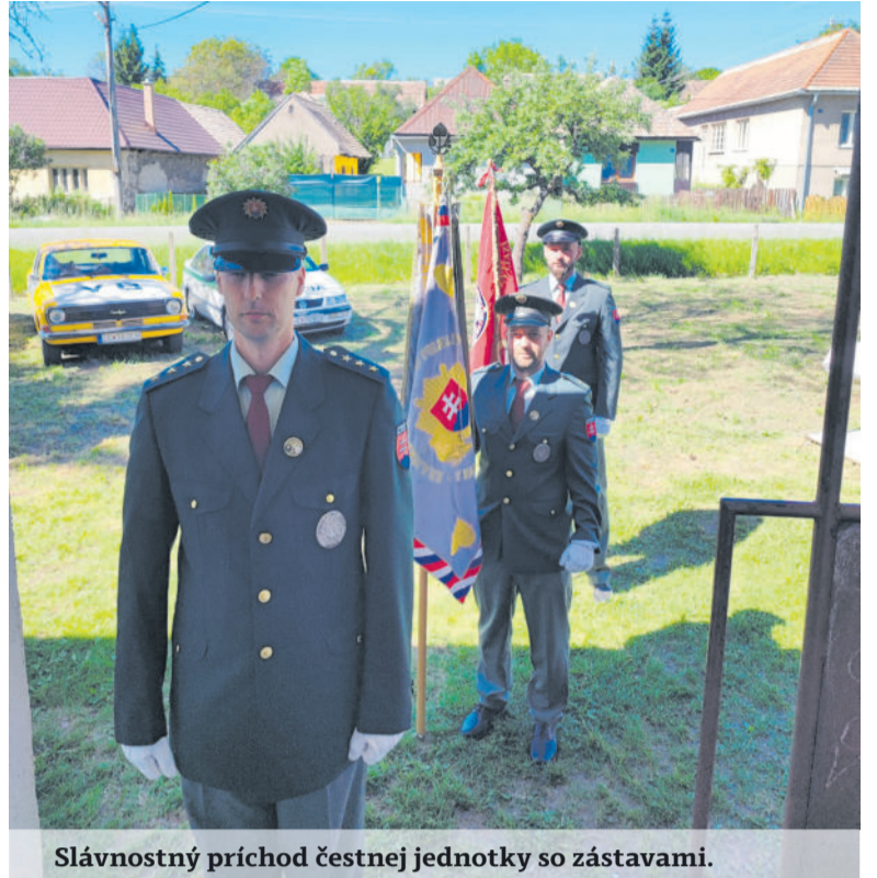
Slávnostný príchod čestnej jednotky so zástavami.